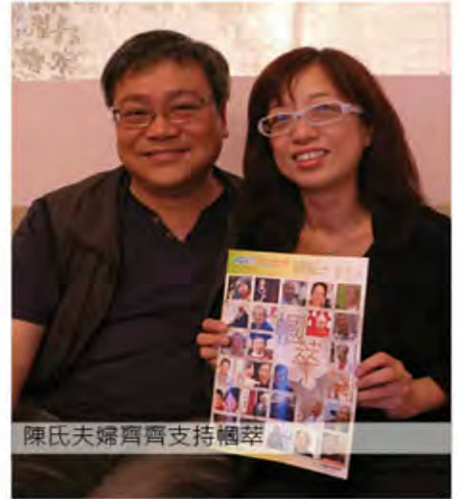
陳氏夫婦齊齊支持楓萃

我們都好奇地問使她經常笑口常開的原因。她說：「人始終會有不開心的時候，但既然開心或不開心還是要工作和過日子，若我們能以開心的態度去面對，不計較得失，最後的得著反而會更多。」