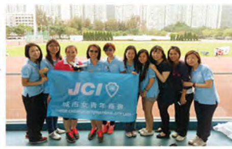
JCI Sports Day - 各位姊妹到場支持