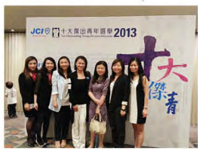
十大傑出青年選舉 2013 記者招待會