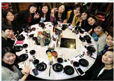
City Lady 活動後齊齊吃火鍋