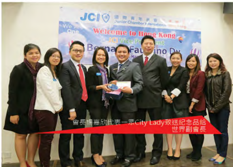
會長標嘉欣代表一眾City Lady致送紀念品給世界副會長

I would like to send my sincerest appreciation to JCI HK members for doing an awesome job in HK. Please continue to implement outstanding projects in your communities. We should also try to get more members to share their talents and time to help create positive change in our communities. You can start with your friends and family. I encourage you to attend JCI International Events to get a better understanding and appreciation of JCI as a global family. I hope to see you in Aspac Gwangju, Korea or The Global Partnership Summit at the United Nations in New York and certainly the World Congress in Rio de Janeiro, Brazil in November. See you all soon and let us all Dare to Act!