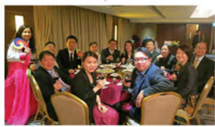
四月份會「躍動·光州夜」- 韓國主題晚宴