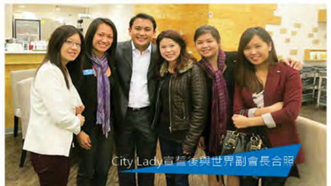
City Lady宣誓後與世界副會長合照