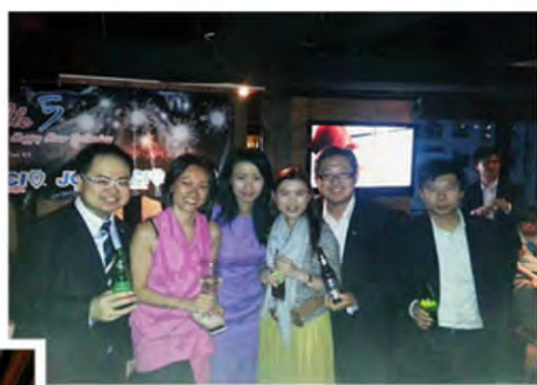
五會聯辦Happy Hour 五位會長舉杯合照