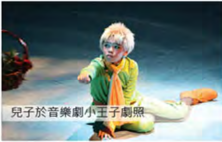
兒子於音樂劇小王子劇照