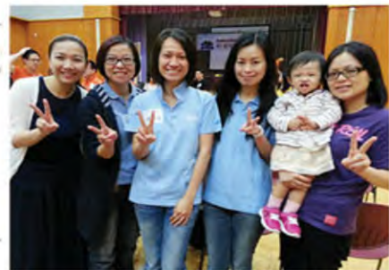
皇者之皇 - JCI Quiz