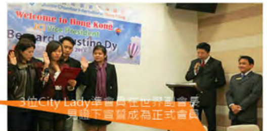
3位City Lady淨會員在世界副會長身臨下官晉成為正式會員