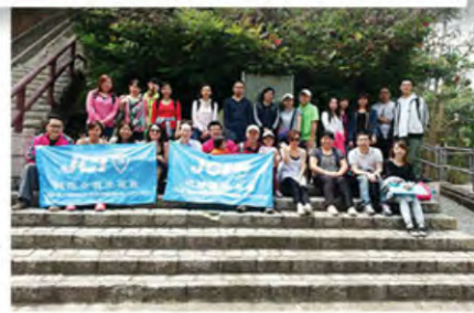
經緯青年商會聯辦到青衣周日遠足遊